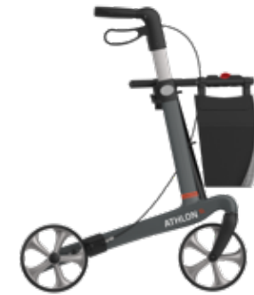
Grau, TPE -Räder

Carbon ist ein besonders leichtes, aber sehr robustes Material. Der Carbon-Rollator ist demzufolge superleicht, dabei aber auch sehr stabil und sicher.