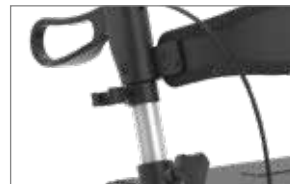
Smart Turn – Stockhalter dreht sich beim Falten