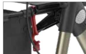
Bügel zum Sichern im Faltmodus