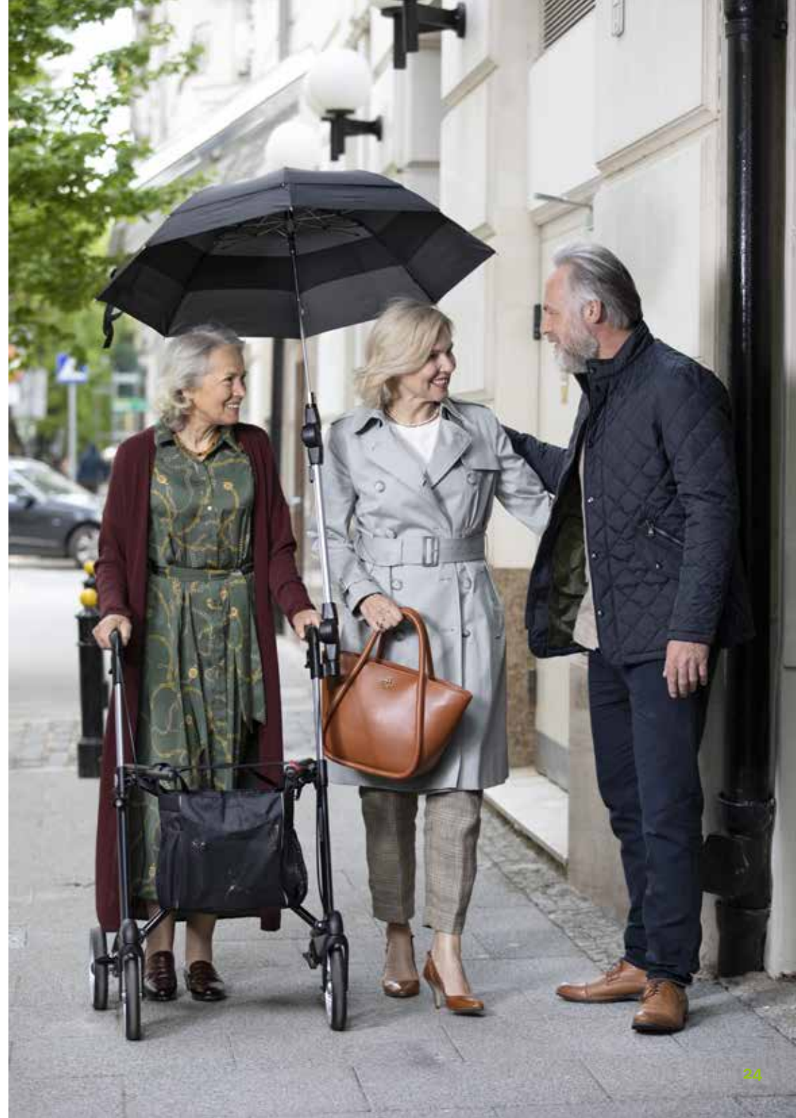
rechts: SERVER mit Regenschirm