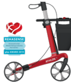
Rot, TPE -Räder